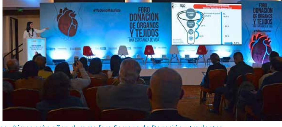
Directora INS en presentación: una mirada al trasplante en los últimos ocho años, durante foro Semana de Donación y trapiantes

“El 68% de los trasplantes han favorecido a personas de los estratos 1,2 y 3”